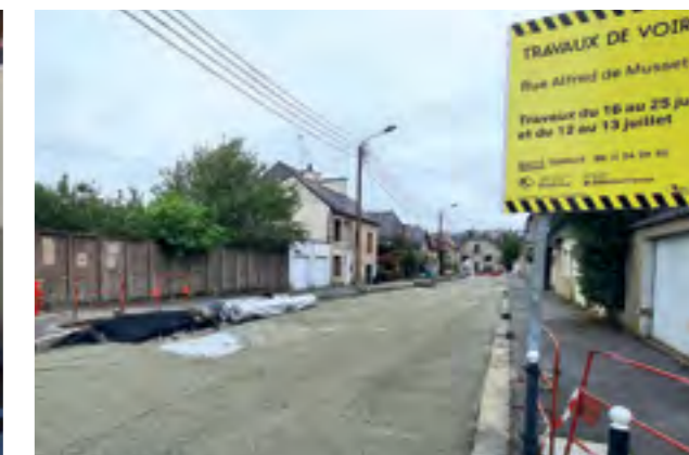
Étanchéité des voiries