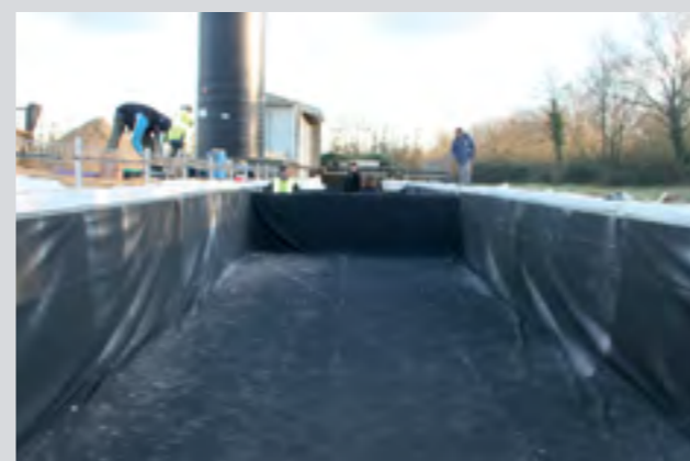
Bassin technique pour un industriel (exemple : traitement des eaux de process)

*La contenance des effluents doit être connue par le service commercial afin de vérifier la compatibilité avec nos membranes.