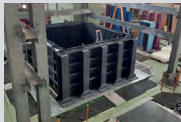
Bassin industriel spécifique