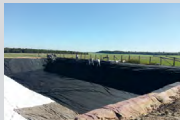
Bassin agricole (exemple stockage effluents)