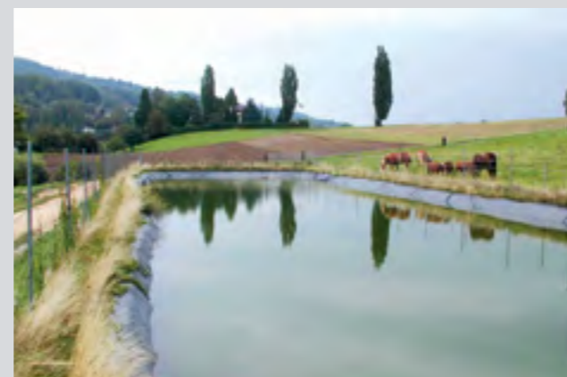
Bassin à ciel ouvert